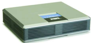
Linksys® SPA2100-SF phone adapter Adaptador de teléfono del Internet de Linksys® SPA2100-SF