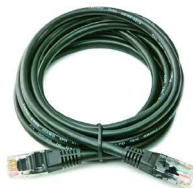
Ethernet cable Cable de Ethernet